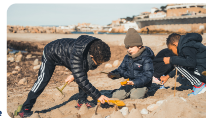
Sortie Ecoles Chateaubriand et Antoine de Ruffi

Le grand bain c'est aussi et surtout une belle représentation de la mixité présente dans notre magnifique ville !